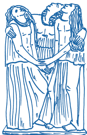
PŁASKORZEŻBY NA COKOLE KOLUMNY: TRZY POLSKI I PRZEDSTAWIENIA NAWIĄZUJĄCE DO UTWORÓW MICKIEWICZA

Zwróć uwagę na elementy, z jakich składa się pomnik. Zastanów się jakie może być ich symboliczne znaczenie.