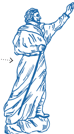
ADAM MICKIEWICZ JAKO KROCZĄCY PIELGRZYM, W LUŻNYM PŁASZCZU, Z LASKĄ I WYCIĄGNIĘTĄ W GÓRĘ RĘKĄ