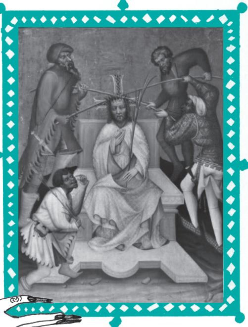
Kwaterna z Poliptyku Grudziądzkiego, ok. 1390