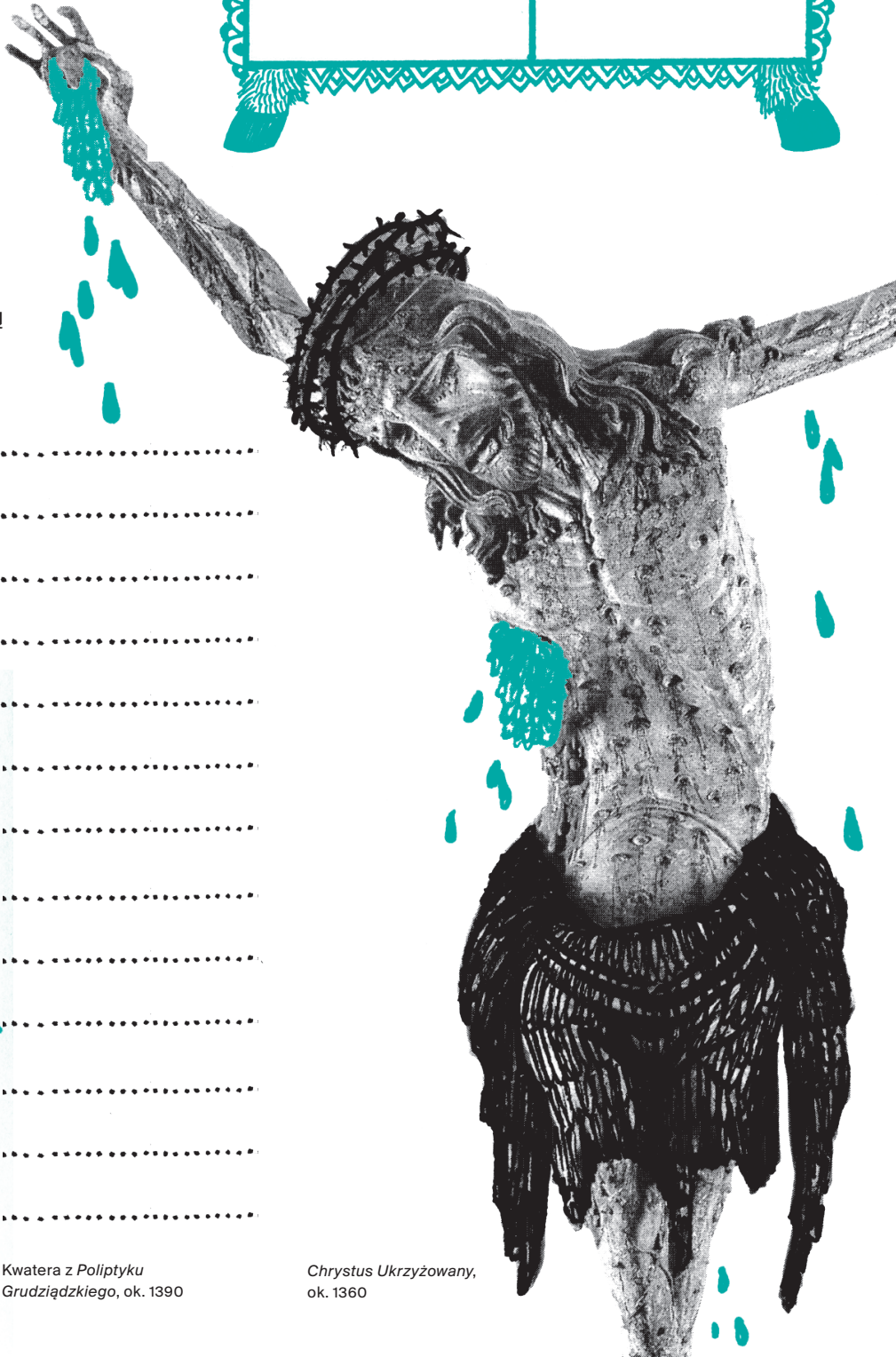
Chrystus Ukrzyżowany, ok. 1360